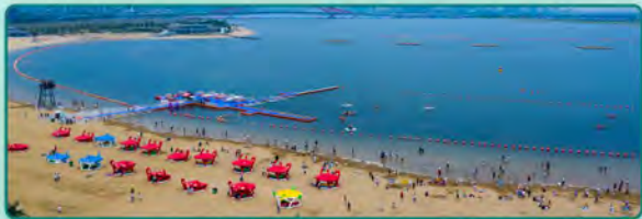
梅山水道沙滩公园

近年来，北仑区积极推进近岸海域污染防治，探索实施“陆海统筹、河海兼顾、上下联动、协同共治”治理新模式。梅山水道通过系统治理、数智引航及生态修复工作，河道生物种类和数量得到了明显的恢复，真正让水“清”起来、“流”起来、“活”起来，形成美丽河湖向幸福河湖的蝶变。