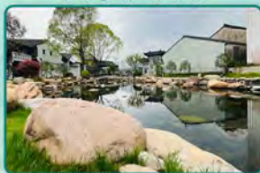
萧王庙联步青云景区